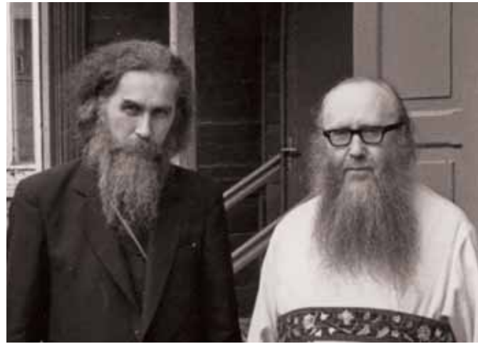
Архимандрит Иннокентий (Провсвирнин) и митрополит Симон (Новиков)

(Полный текст этой и других проповедей митрополита Симона (Новикова) будет опубликован в двухтомнике «Проповеди и Труды», который готовится к выходу издательством Новоспасского монастыря, и в ближайшем времени поступит в нашу книжную лавку).