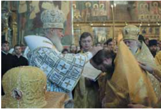
Возведение в сан архимандрита

Кстати, неплохо было бы, если бы именно они стали распространять и эту нашу новую газету. Ведь в рамках молодежной организации каждую пятницу вечером у нас проходят беседы, куда прийти может любой желающий, и я тоже бываю там. Темы этих бесед самые разные. Одна из недавних была посвящена образованию, причем не тому, какие проблемы переживает нынешнее образование вообще, а более конкретному разговору. Например, что делать молодому человеку, если он уже