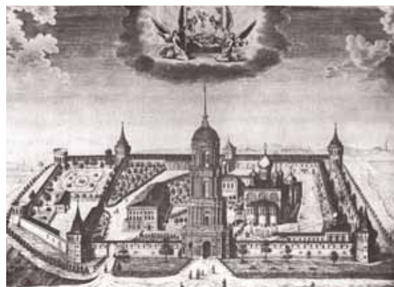
Новоспасский монастырь в 1751 году

Здесь покоятся родоначальник Романовых – Роман Юрьевич Захарьин, его сыновья, мать первого царя рода Романовых великая государыня инокия Марфа (Ксения Иоанновна Шестова-Романова), пострадавшие при Годунове братья Патриарха Филарета и их отец Никита Романович Юрьев (в схиме Нифонт), царевна Ирина, дочь Михаила Феодоровича, и другие яркие представители этого судьбоносного для России рода. Последними его представителями, нашедшими место последнего упокоения в стенах обители, стали инокия Досифей (княжна Тараканова, умершая в 1810 году) и великий князь Сергей Александрович (умер в 1905 году) – генерал-губернатор Москвы, командующий Московским военным округом, сын Императора-освободителя Александра II и дядя святого страстотерпца императора Николая II. Останки Сергея Александровича были торжественно, с отданием воинских почестей, перенесены в Новоспасский монастырь в 1995 году из Кремля.